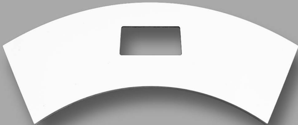
Piano di lavoro

Lo scalino del foro aspiratore deve essere rivolto verso l'ALTO per alloggiare la piastra