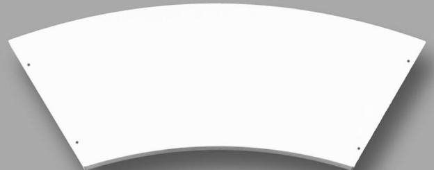
Mensola sotto il piano